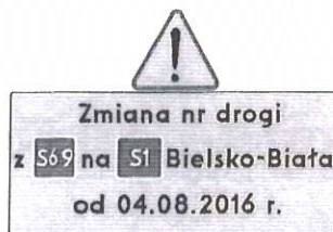
Tablica nr 3 w Zwardoniu (rejon przejścia granicznego)