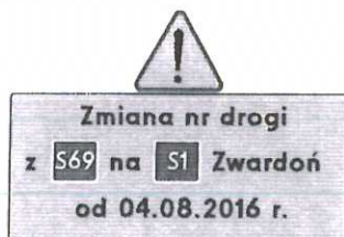
Tablica nr 1 w Bielsku-Białej (węzeł "Bielsko-Biała Komorowice")